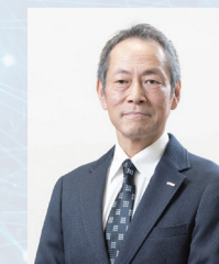
代表取締役 社長執行役員

統合によって高めた総合力を原動力に新たな価値を創出し続ける存在となり、デジタルの力で「くらし」と「しごと」を幸せにすることを実現して、企業と社会の可能性を広げ、持続可能な未来をともに切り拓いてまいります。